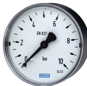
Манометр с трубкой Бурдона модель 111.12